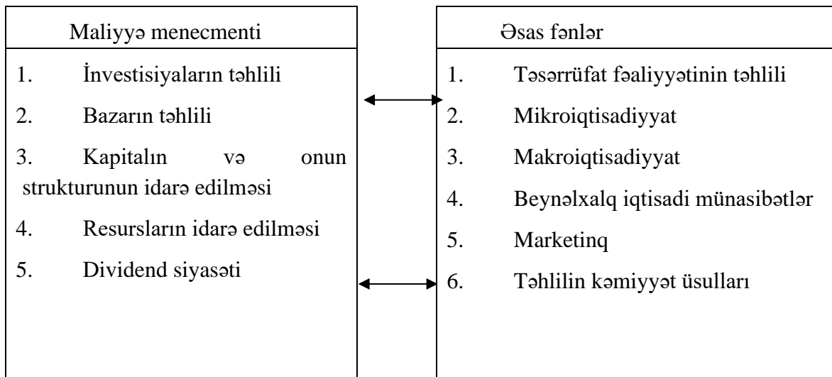
Sxem 1.1 Maliyyə menecmenti nəzəriyyəsinin digər fənlərlə qarşılıqlı əlaqəsi.

İ.İ. Qerçikova maliyyə menecmentinin iqtisadi metodları ilə qarşılıqlı əlaqələr üzrə funksiyaları təsnifləyərək, onları iki blokda qruplaşdırır: xarici maliyyənin idarəedilməsi üzrə blok (firmanın aktivlərinin idarə edilməsi; pul vəsaitlərinin hərəkəti; müştərilərlə